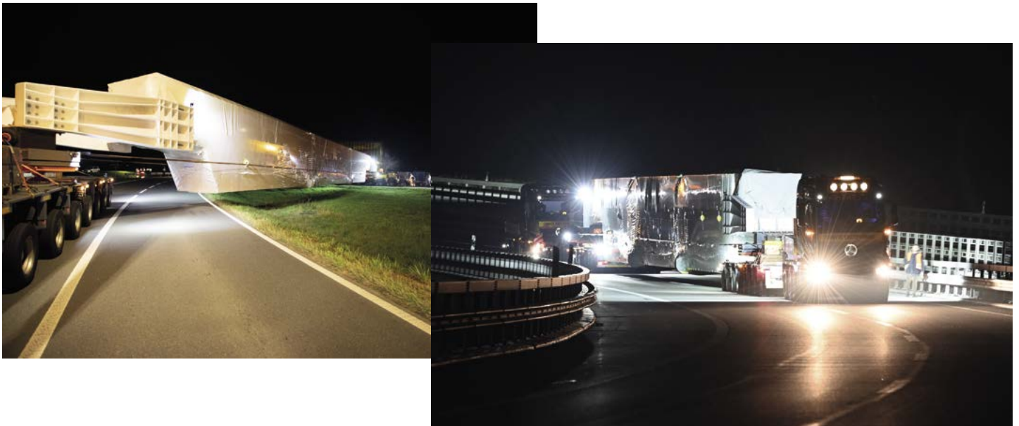
Sur le viaduc, une personne marchait à côté du convoi pour s'assurer qu'il ne franchissait pas le marquage.