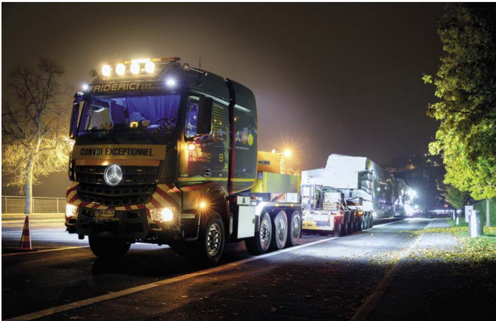
Petite pause sur l'aire de repos du Pertit avant les tunnels de Glion.