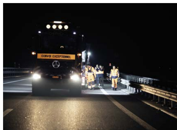
Un marquage sur le sol du viaduc de Chillon déterminait l'emplacement que devaient suivre les roues du convoi pour ne pas endommager la structure.