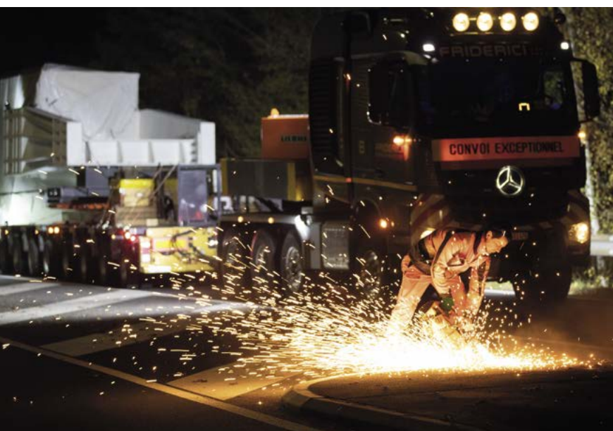
Par endroits, la signalisation a dû être provisoirement démontée.