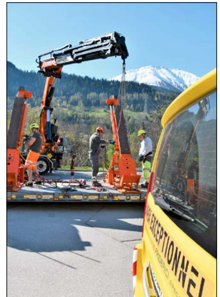
Les supports orange sont inclinés afin d'accueillir correctement le bac de rétention.