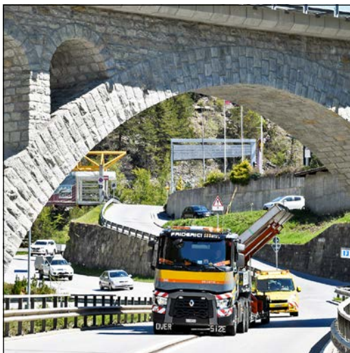
Ce pont, près de la gare de départ du téléphérique de Bettmeralp, n'occasionne aucune difficulté. Il en ira...

vants: le point le plus haut du chargement se trouve à 4,25 m du sol. Le bac dépasse en outre la largeur du camion de 65 cm à droite et de 1,20 m à gauche. C'est donc «tout bon» pour franchir avec succès la première difficulté qui est la traversée du village de Lax. Il s'agit tout d'abord de passer sous la voûte du viaduc de la ligne ferroviaire de la Furka (photo ci-dessus), puis de faire attention à ne heurter ni les toits des chalets construits au bord de la route cantonale, ni les trottoirs.