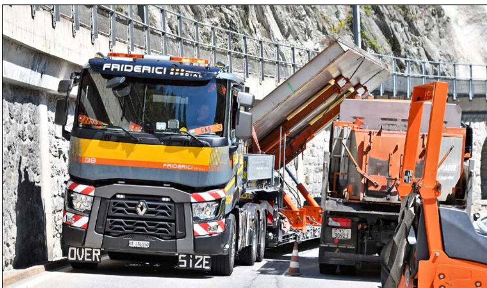
...différemment un peu plus loin en croisant un camion stationné sur un chantier relativement étroit. Le convoi exceptionnel parvient cependant à se faufiler de justesse, à très faible allure.

La seconde difficulté consiste à croiser un camion stationné sur un chantier qui se trouve juste après la gare de départ du téléphérique de Bettmeralp. Le convoi exceptionnel y passe de justesse (photo ci-dessous). Il n'aurait pas