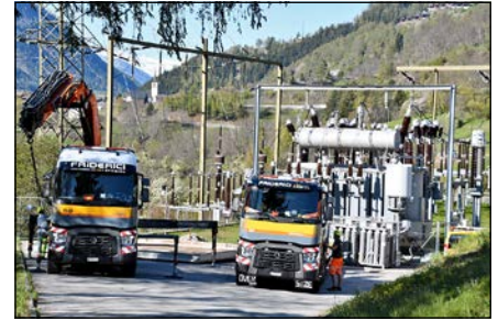
A la centrale d'Ernen: Emin Fejzullahi a déjà déployé les béquilles de son camion.