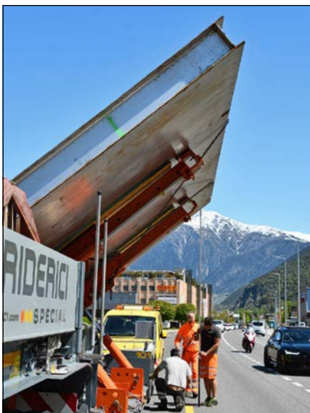
A Eyholz: l'inclinaison est modifiée. Il n'y a désormais plus de toits de chalets à éviter!