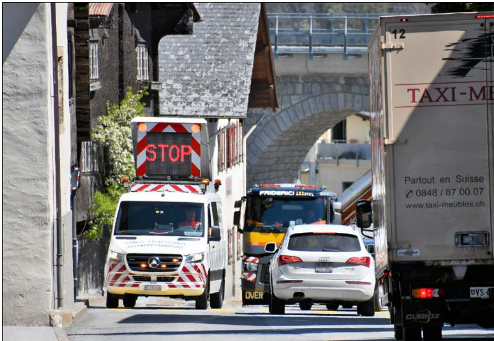
La première difficulté du trajet est constituée par la traversée de Lax. Il ne faut heurter ni la voûte du viaduc de la ligne ferroviaire de la Furka, ni les toits des chalets, et encore moins les trottoirs.