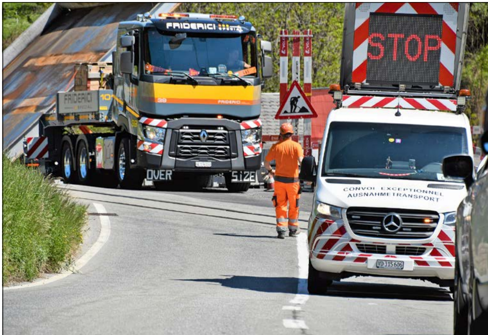
Le franchissement de la voie ferrée à Mörel a lui aussi été compliqué. Les supports où était déposé le bac avaient cependant été inclinés en tenant compte de l'irrégularité de la chaussée à cet endroit.